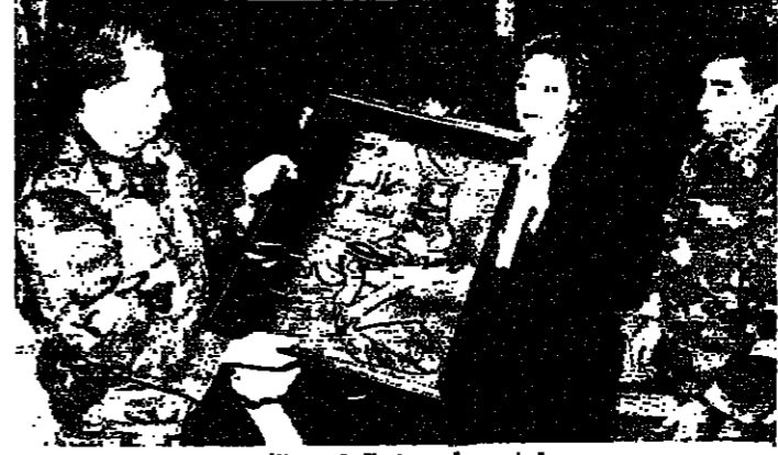
يشمل هدية من لجنة تكريم الأب

شدد رئيس مجلس الوزراء العماد عون على أن التلاحم الموجود بين الجيش اللبناني والشعب اللبناني قوي في شكله أن كل الإلحاح من البعض لن تؤثر عليه. وقال إن مناعة الجيش والشعب ستغلب على كل الصعاب. مشيراً إلى أن إنجازات نواة الجيش في السنتين ٧٥ - ٧٦ جبرت إلى الملتصقات. وأوضح أنه لا يمكن التخلص إلا بالخروج من المؤامرة ومواجهتها.